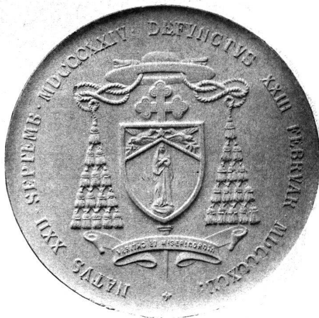
MÉDAILLES DE M gr MERMILLOD, DE M.M. L. RUCHONNET ET J. E. DUFOUR.