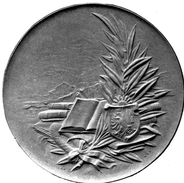
Médailles de M. Alphonse de Candolle et du Comte Tolstoï.