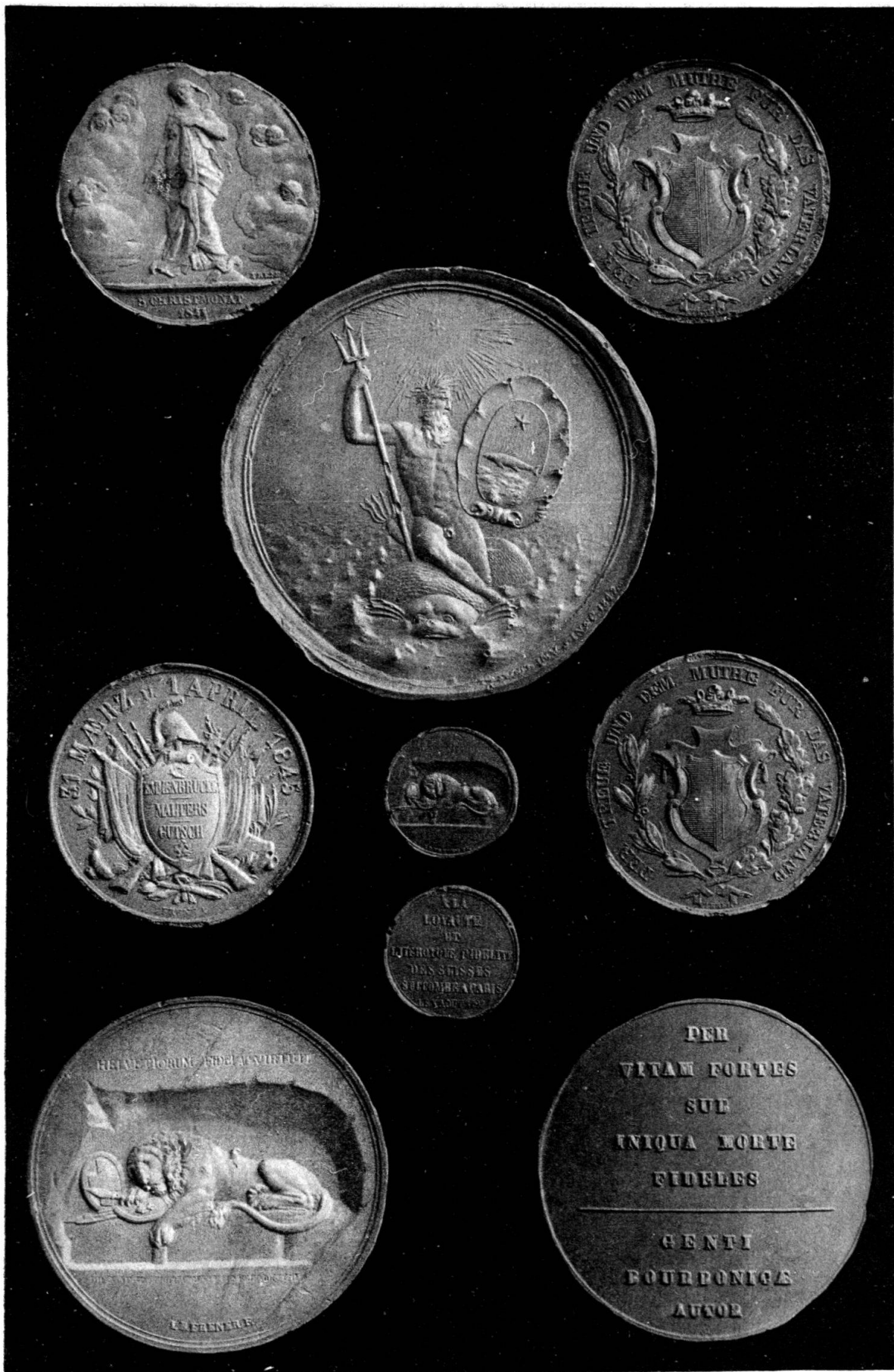
MEDAILLEN VON J.-B. FRENER AUS LUZERN