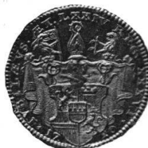
Medaillen des Klosters Muri.