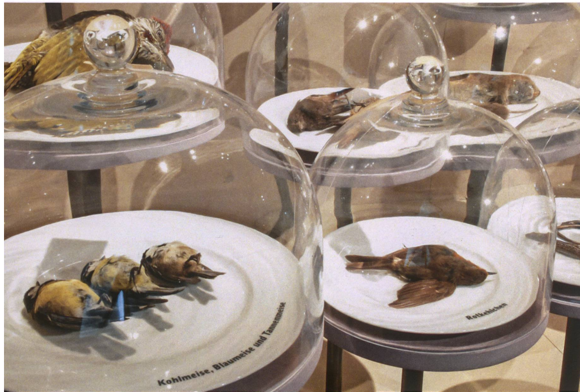
Eine Auswahl an Beutetieren der Hauskatze

Der amerikanische Historiker hat Recht, doch das Beutespektrum von Hauskatzen umfasst weit mehr als nur Mäuse. Wie stark sie dabei die Beutetierpopulationen beeinflussen, lässt sich nicht verallgemeinern. Eine Studie im Wallis setzte die Zahl von Katzen erbeuteten Vögeln mit dem Bruterfolg der Population ins Verhältnis. Das Ergebnis: trotz hohen Verlusten nahm der Bestand an Vögeln weiter zu. Unbestritten ist jedoch, dass auf Inseln wie Mauritius verwilderte Hauskatzen mitverantwortlich sind für das Aussterben lokaler Tierarten.