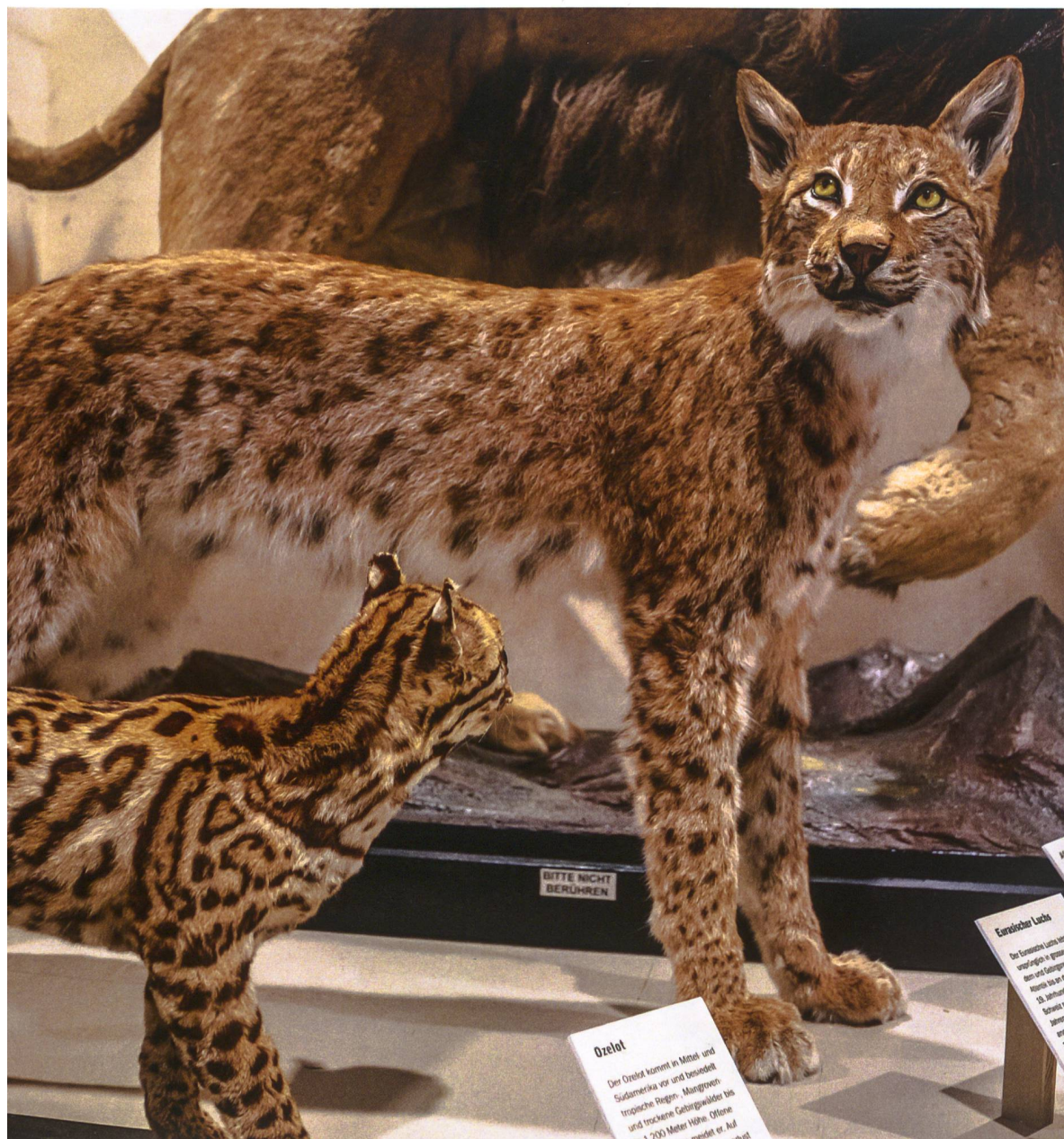
Ozelot und Eurasischer Luchs: zwei Vertreter der Felidae

Ob Hauskatze oder Tiger: alle Katzenarten sind sich in ihrem Körperbau grundsätzlich ähnlich. Hingegen zeigen sie in Grösse und Fellzeichnung klare Unterschiede. Vielfältig sind auch die Lebensräume, die die verschiedenen Arten weltweit besiedeln. Sie kommen von den Meeresküsten bis ins Hochgebirge auf 6000 Metern über Meer vor und fühlen sich in Wüsten ebenso zu Hause wie in tropischen Regenwäldern.