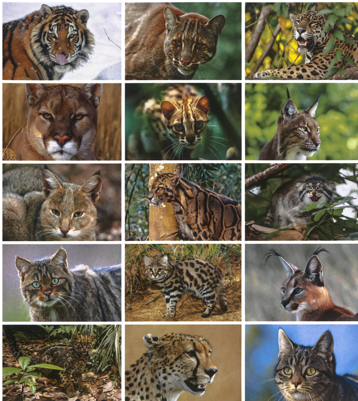
Sibirischer Tiger / Asiatische Goldkatze / Jaguar Puma / Bengalkatze / Eurasischer Luchs Rohrkatze / Nebelparder / Manul Europäische Wildkatze / Goldkatze / Karakal Marmorkatze / Gepard / Hauskatze

Allen Katzenarten gemeinsam sind der kleine, rundliche Schädel, das kurze, flache Gesicht und grosse, nach vorne gerichtete Augen. Zwischen den Arten gibt es dennoch erstaunliche Unterschiede.