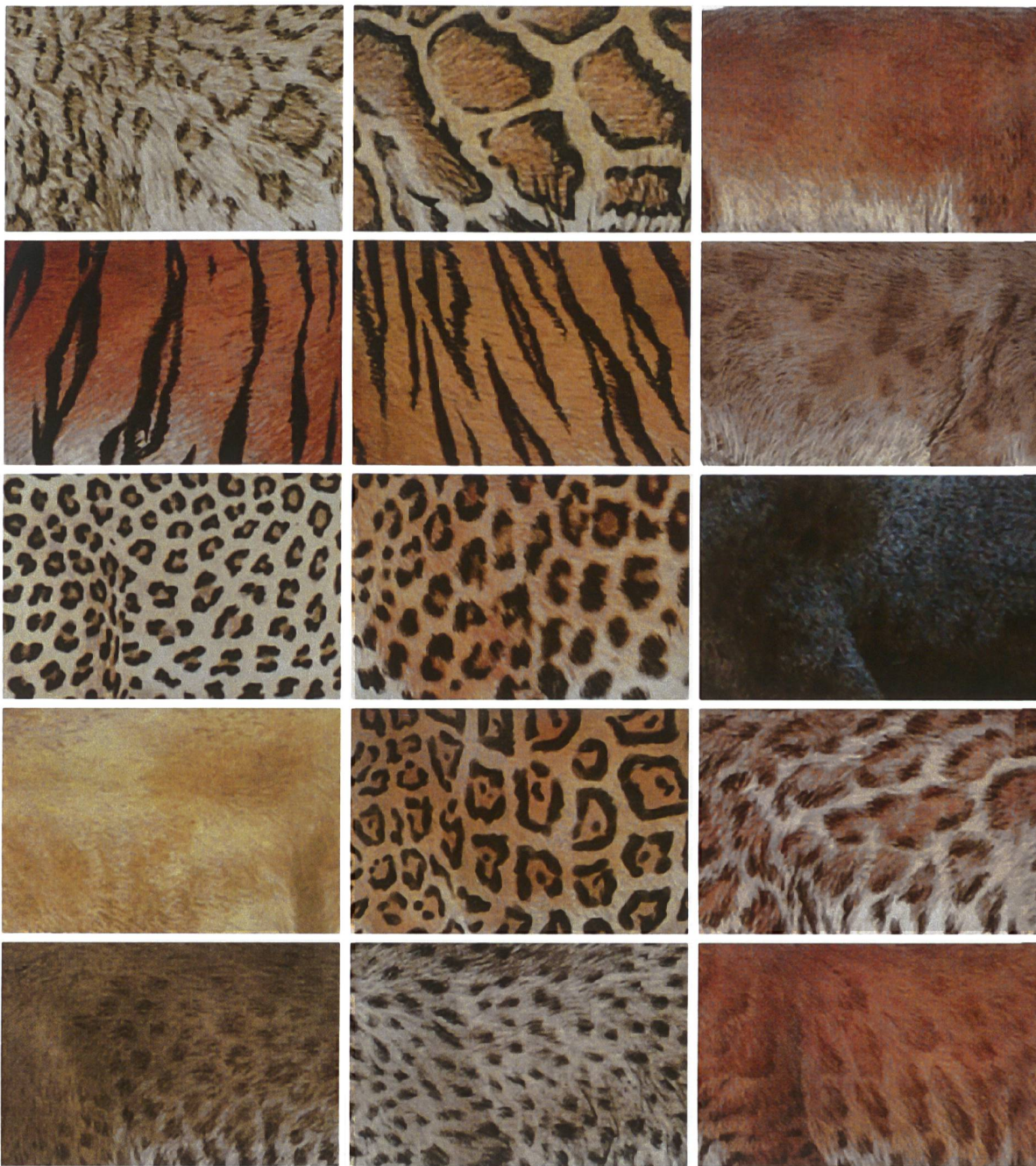
Schneeleopard / Nebelparder / Borneo Goldkatze Sumatra Tiger / Indischer Tiger / Puma Afrikanischer Leopard / Amurleopard / Indochinesischer Leopard Afrikanischer Löwe / Jaguar / Asiatische Goldkatze Afrikanische Goldkatze / Kleinfleckkatze / Rotluchs

Die Fellzeichnungen der verschiedenen Katzenarten variieren stark. Die Muster sind eine Anpassung an den jeweiligen Lebensraum und tarnen die Tiere perfekt. Die Felle vieler Katzenarten erzielen hohe Preise – ein Grund, weshalb diese bedroht sind.