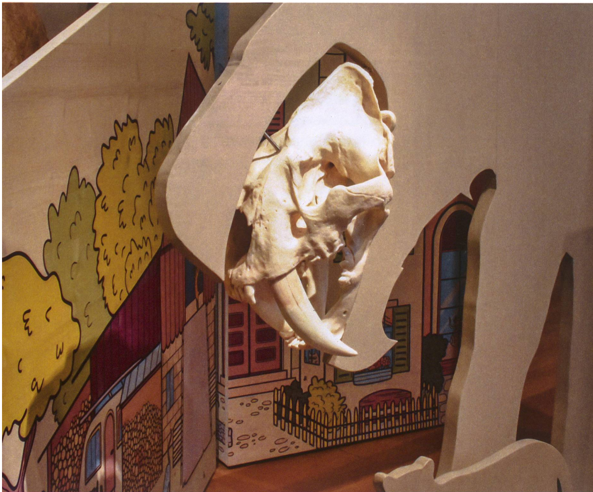
Schädelabguss eines Säbelzähntigers

Zeit genug ein Meisterwerk zu werden, hatte sie: Die Hauskatze gehört wie die längst ausgestorbenen Säbelzahnkatzen oder der einheimische Luchs zu den Katzen ( Felidae ), einer Familie der Raubtiere. Ihre Entwicklung beginnt vor rund 40 Millionen Jahren. Als «Urkatze» gilt der dem Ozelot ähnliche Pseudailurus . Vertreter der Felidae leben heute in Nord- und Südamerika, Afrika, Europa und Asien.