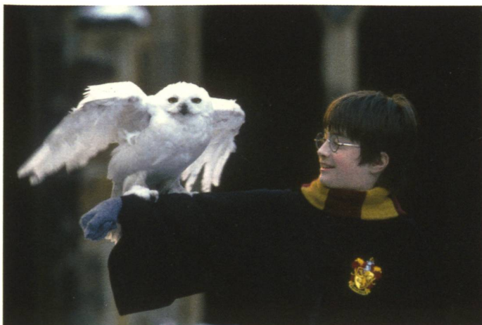
Harry Potter mit Hedwig