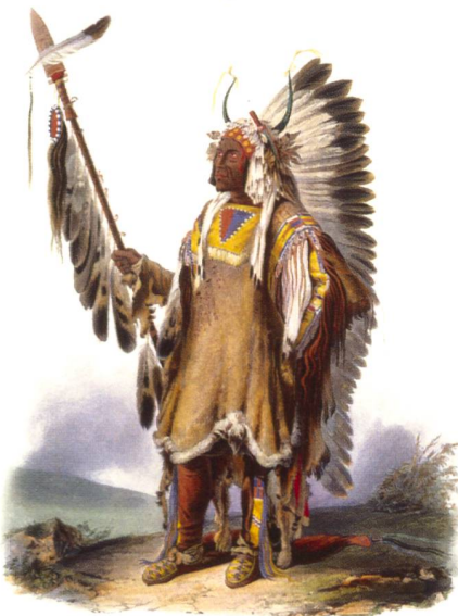
Mandanhäuptling Mató-Tópe mit Adlerfedernschmuck