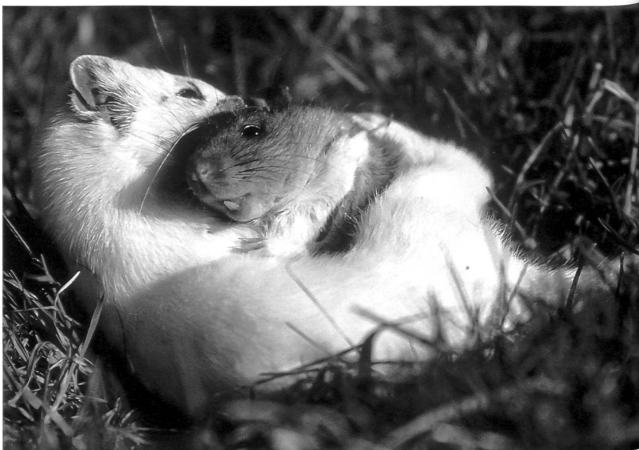
Tödlich endet die Begegnung von Räuber und Beute. Das Hermelin überältigt eine Wanderratte.