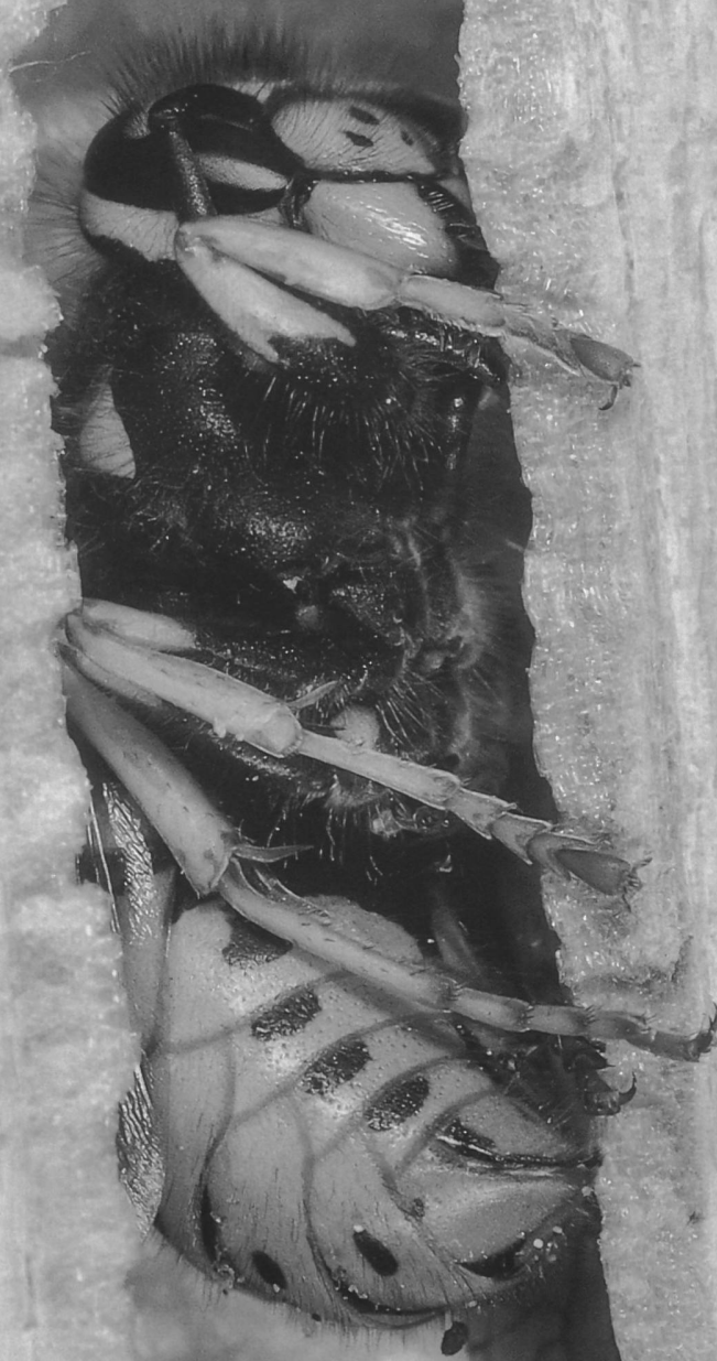
Wespe in einem hohlen Pflanzenstengel in Kältestarre. Wespenvölker sterben im Herbst ab. Es überwintern nur die Jungköniginnen, die im Frühling neue Völker gründen.