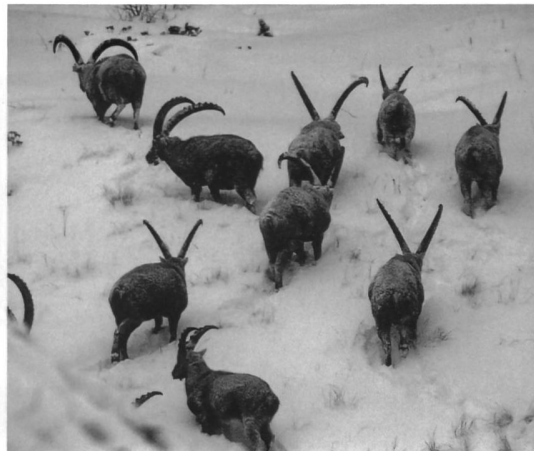
Die Winternahrung des Steinbocks ist nicht nur karger, sondern vielfach auch von Schnee bedeckt.