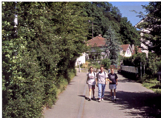
... und jetzt