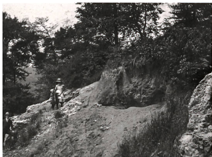
Fundstelle einst ...