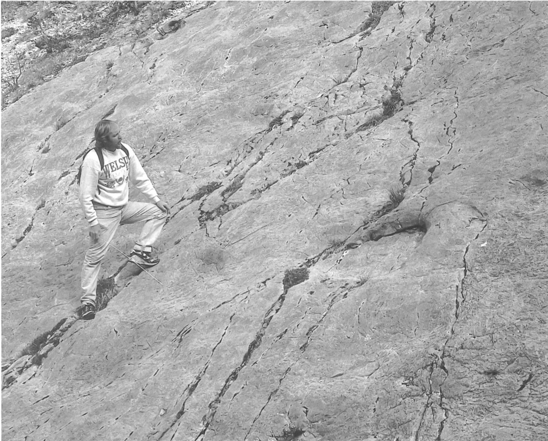
Ansicht der neuen Fährtenfundstelle von Moutier. In der Bildmitte ist ein Vorder- und Hinterfusseindruck eines Brontosauriers zu sehen.