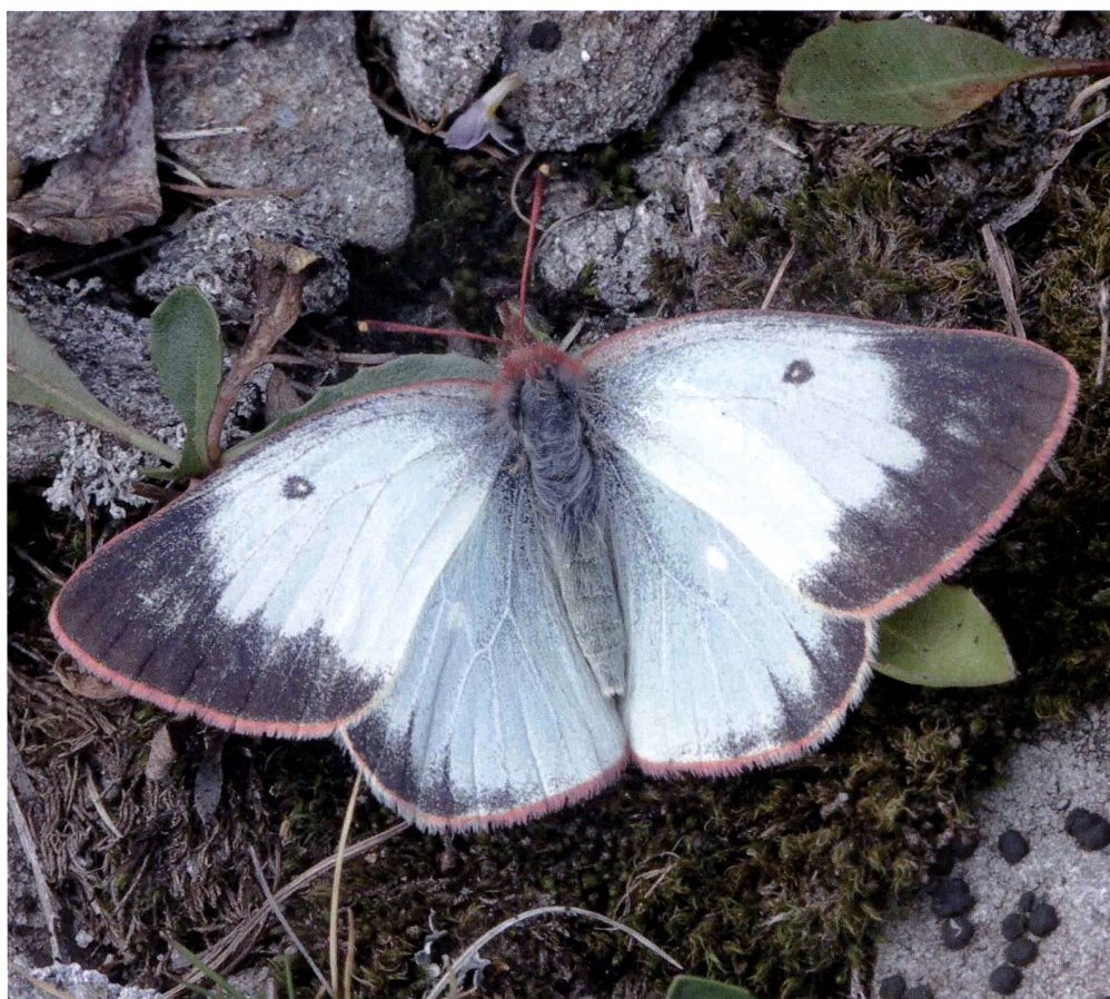
Fig. 3 – Esemplare femmina di Colias palaeno