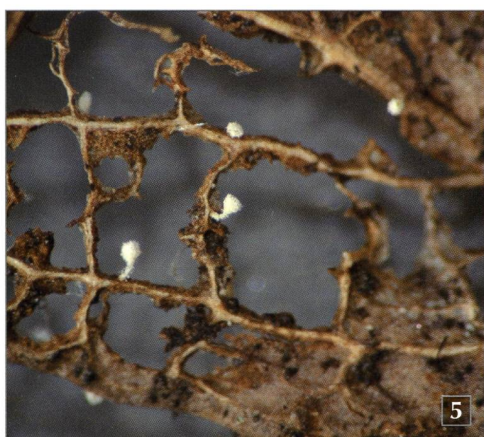
Fig. 5 – Lachnum microsporum Velen. su foglia marcescente di mirtillo di palude ( Vaccinium uliginosum ).