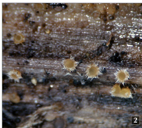
Fig. 2 – Urceolella crispula (P.Karst.) Boud. su stelo di Adenostyles alliariae .