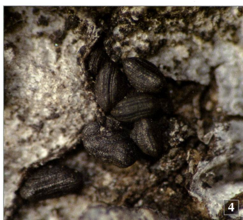
Fig. 4 – Oedohysterium insidens (Schwein.) E. Boehm & C.L. Schoch. su ramoscello di larice ( Larix decidua ).