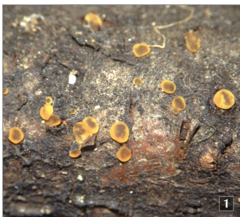
Fig. 1 – Orbilbia coccinella Fr. su ramo di ontano verde ( Alnus viridis ).