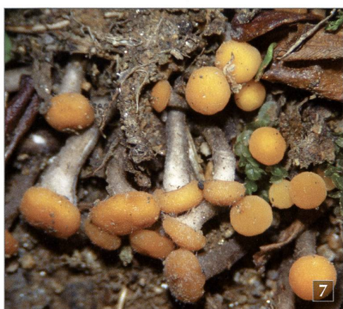
Fig. 7 – Vibrissea truncorum (Alb. & Schwein.) Fr. su ontano verde ( Alnus viridis ), interrato in zona umida.