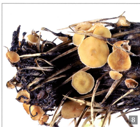
Fig. 8 – Crocicreas calathicola (Rehm) S.E. Carp. su fiore marcescente di Cirsium spinosissimum .