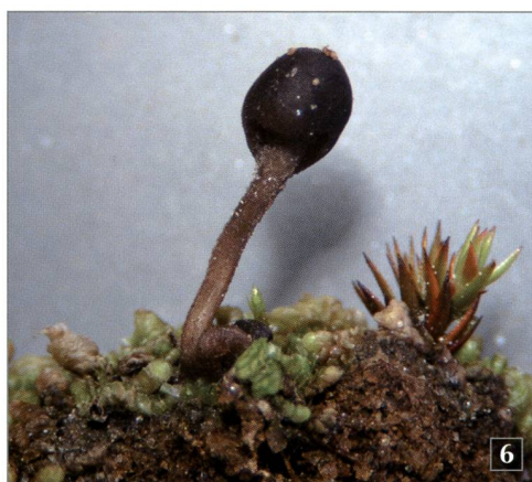
Fig. 6 – Sarcoleotia globosa (Sommerf. ex Fr.) Korf su terreno arenoso con muschi.