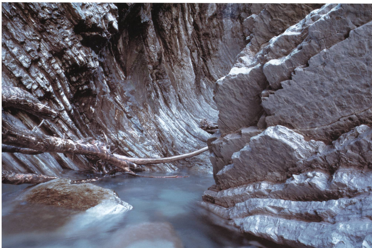
Foto di A. Bosisio (concorso fotografico, 2001). Incisione tratta da «AQUA» di D. Carrara-Oppizzi, M. Martini, M. Mucha e A. Pagani (cartella preparata in occasione della manifestazione di inaugurazione del paesaggio fluviale del Ghitello, 2005).