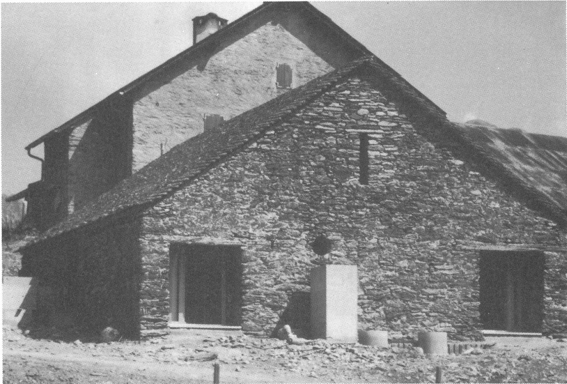
b) Lo stabile B è stato adibito a refettorio e dormitorio.

Lo scopo di questa collezione è quello di far trovare sul posto il materiale necessario per le attività didattiche. Soprattutto a livello universitario è riconosciuta l'importanza fondamentale dell'esistenza di dati scientifici pregressi per le indagini attuali. Infatti, è risaputo che la Val Piora è un luogo classico per gli studi in idrobiologia e idrologia, con una lunga e documentata tradizione di 200 anni di ricerca (PEDUZZI, a & b, 1983).