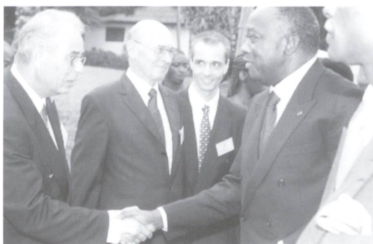
50 Jahre CSRS Seite 20