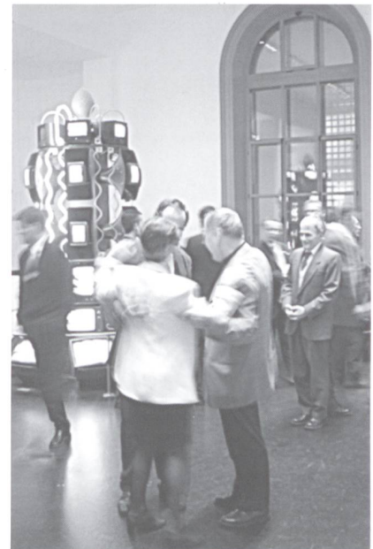
Zwischenhalt Seite 11