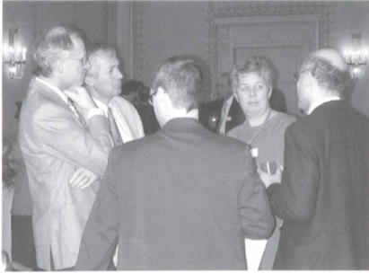
Dialog mit dem Parlament Seite 6