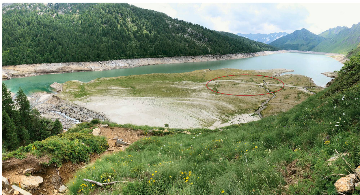
Figura 3: Delta della Murinascia esposto sul lago Ritom. In rosso evidenziata l'area più densamente colonizzata dalle briofite, adiacente il torrente Murinascia di Cadagno, di cui è ben visibile il tracciato. Giugno 2021.