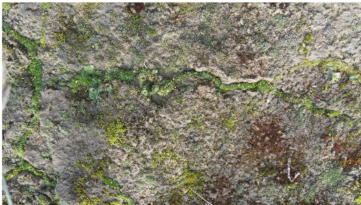
Figura 1: Flora muscinale su suolo nudo, delta della Murinascia, 30.9.2020 (lago Ritom, Svizzera;).