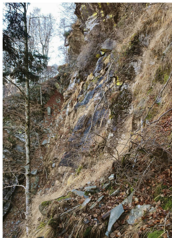
Figura 4: Ripido pendio roccioso e boscato nell'area A, nelle vicinanze della stazione 1, a Linescio (Svizzera).