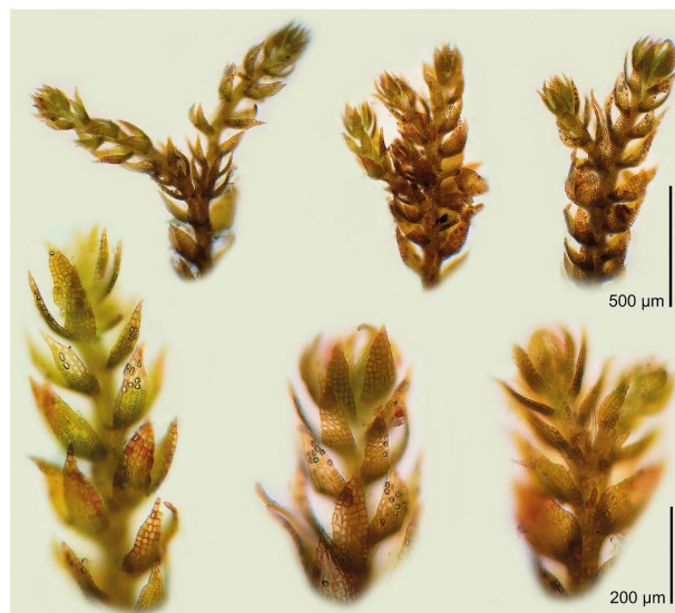
Figura 3: Fusti di Sphenolobopsis pearsonii raccolti nella stazione 1. Per la grandezza e le foglie laterali composte da due lobi la specie è simile all'epatica Cephaloziella , ma si distingue per le ramificazioni terminali che sono rare in quest'ultima. Una descrizione dettagliata della specie si trova in Damsholt, 2002.