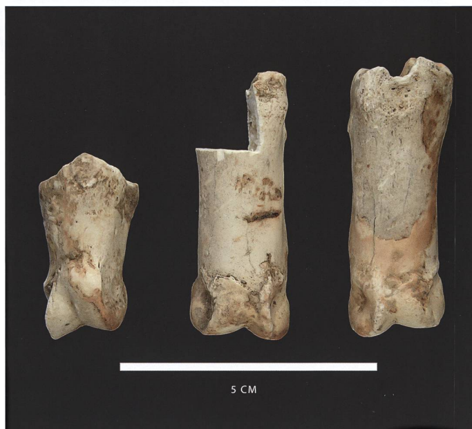
Figure 1: Phalanges de bouquetin ( Capra ibex ) du Pléistocène supérieur (Grotta Gerosa, Castel San Pietro).

La grotte G3 (Echantillon SpéléOs n° 148-14) a livré des ossements d'ours brun ( Ursus arctos ), un humérus gauche (fig. 4) et un tibia gauche. La datation de l'humérus a livré un âge calibré de 47457-43657 BC ( 43920 \pm 903 14C BP, ETH-64938, tab. 2). La mesure du diamètre transverse minimum de la diaphyse (DTmD) a donné la dimension de 31.0 mm, confirmant l'appartenance plus probable à U. arctos (22.4-43.0 mm) plutôt que U. spelaeus (35.8-55.5 mm) selon les dimensions