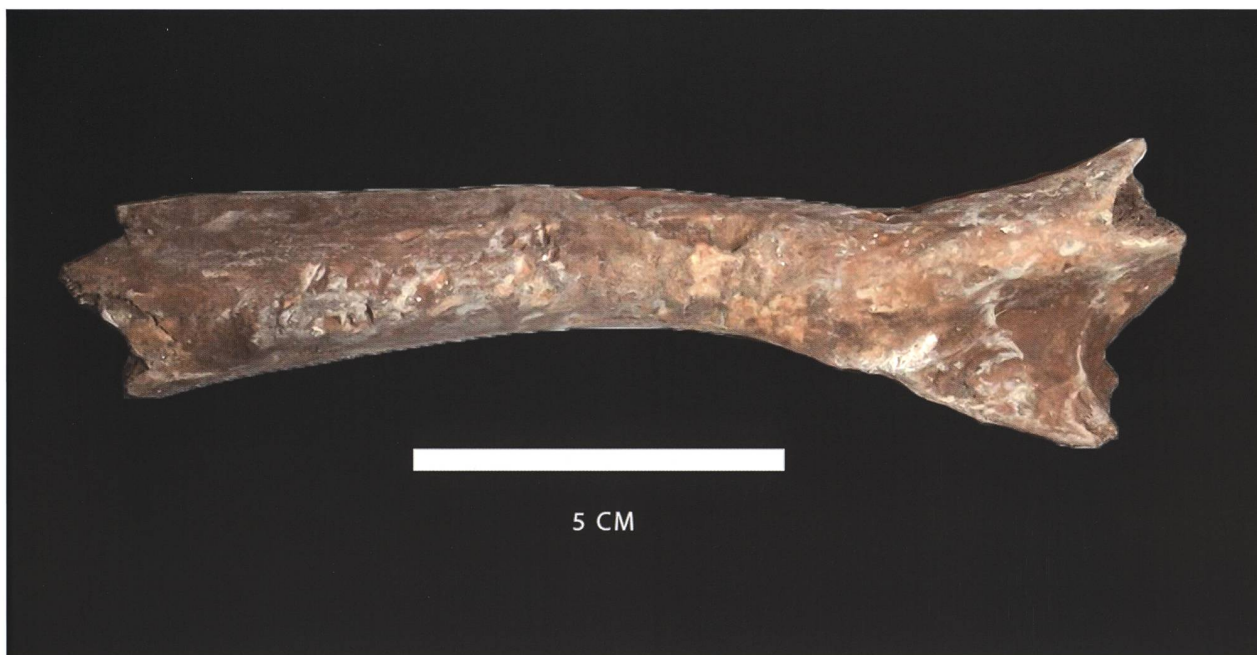
Figure 3: Humérus d'ours brun ( Ursus arctos ) juvénile (Grotta Bas, Rovio) (foto: Michel Blant).