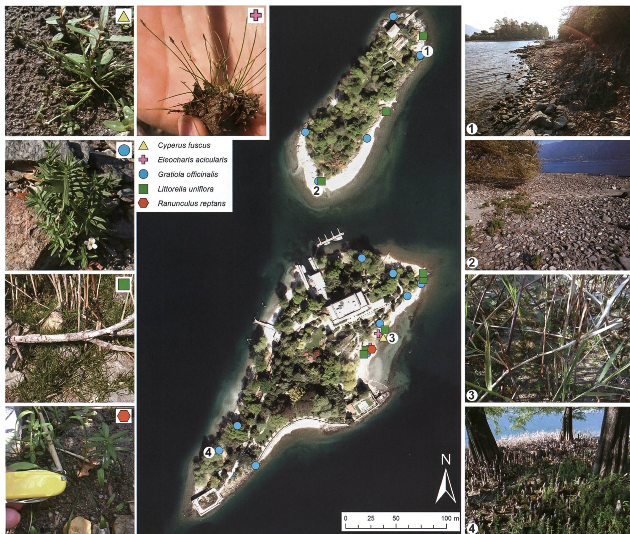
Figura 1: Distribuzione delle specie caratteristiche della zona ripuale e iscritte nella Lista rossa rilevate alle Isole di Brissago. Rilievo floristico selettivo di specie spontanee effettuato il 7 ottobre 2016, con il livello del Lago Maggiore a quota 192.36 m s.l.m. (dati della stazione di misurazione di Locarno (nr. 2022; UFAM, 2016). Sono numerate le rive illustrate di fianco. Categoria di minaccia IUCN secondo Bornand et al. (2016): VU: Cyperus fuscus , Eleocharis acicularis e Gratiola officinalis ; EN: Littorella uniflora e Ranunculus reptans . Immagine satellitare delle Isole di Brissago, riprodotta con l'autorizzazione di swisstopo (BA17024).

2.43 m di differenza dal massimo annuale raggiunto in giugno (stazione di misurazione Lago Maggiore – Locarno; UFAM, 2016). Il livello particolarmente basso dell'acqua ha esposto per un mese e mezzo un'ampia superficie di riva, permettendo alla vegetazione ripuale spontanea, ben adattata a questo ambiente, di affiorare in maniera rigogliosa. Le rive sono uno degli ambienti naturali maggiormente minacciati in Svizzera, in particolare dall'edificazione, dall'eutrofizzazione delle acque, dalla regolazione artificiale dei livelli dell'acqua e dalle attività di svago (calpestio), e ospitano numerose specie rare e minacciate, con ben il 65% delle specie caratteristiche di questo ambiente naturale iscritte nella Lista rossa delle Piante vascolari (Delarze et al., 2015; Bornand et al., 2016).