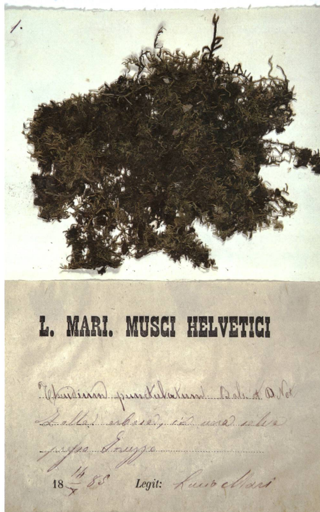
Fig. 2 – Thuidium virginianum (Brid.) Schimp.