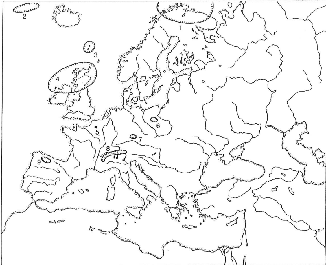
Fig. 3 Corologia atlantico-europea: 1. Lapponia - 2. Groenlandia S-E - 3. Isole Far Oer - 4. Irlanda e Inghilterra sett.li comprese le Isole Ebridi - 5. Ardenne - 6. Altvatergeb. - 7. Sudeti - 8. Alpi - 9. Monti Cantabrici (modificato da OLM I, SAMPO' 1975)