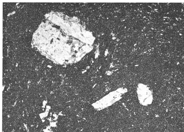
Fig. 3. Croûte de pillow (148 K). Notez les phénocristaux d'albite. Gross.: 16×

ou en grandes plages farcies d'inclusions de „biotite“ brune disposées en éventail; chlorite verte pléochroïque avec teintes de dispersion violettes; carbonate (calcite probable); épidote presque incolore et épidote vert-jaune intense (pistacite), ce minéral est parfois pigmenté en rouge par des poussières opaques; biotites brunes ou vertes; minéral opaque, peut-être hématite; albite en petites plages isométriques parfaitement limpides et