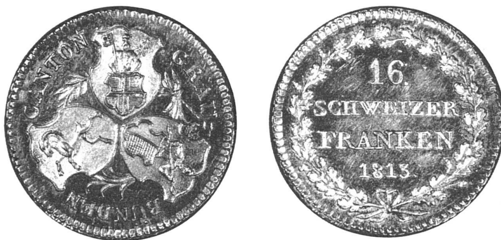
Fig. 3. Dublone zu 16 alten Schweizerfranken, 1813 geprägt aus Calandagold. Auf der Hauptseite die ins Kleeblatt gestellten Wappen der drei Bünde. Durchmesser 22 Millimeter. Gewicht 7,648 Gramm

Weitere Aufschlussarbeiten. Als die Aufschlüsse in der Grube zur „Goldenen Sonne“ den gehegten Erwartungen nicht entsprachen, begann man mit der Untersuchung der umgebenden Gebirgspartien.