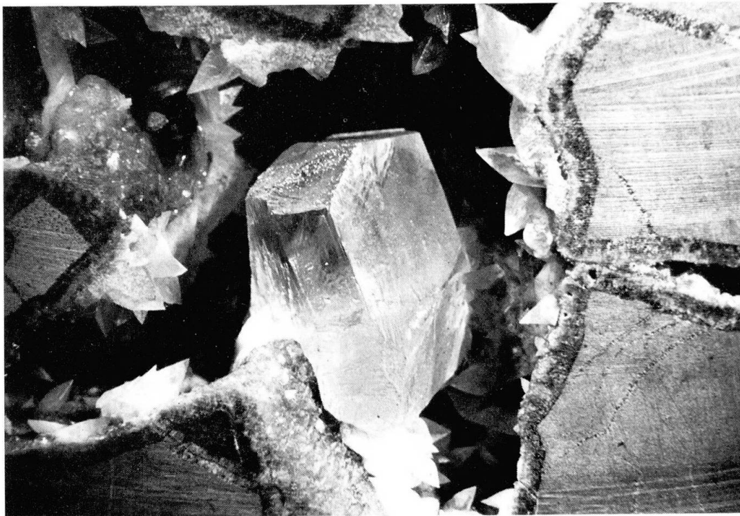
Fig. 1 Whewellite de type I du niveau 2 dans un réseau de fissures tapissées de cristaux de dolomite et de rhomboédres aigus de calcite blanche.

Dimensions en mm: hauteur/largeur: 17/13.