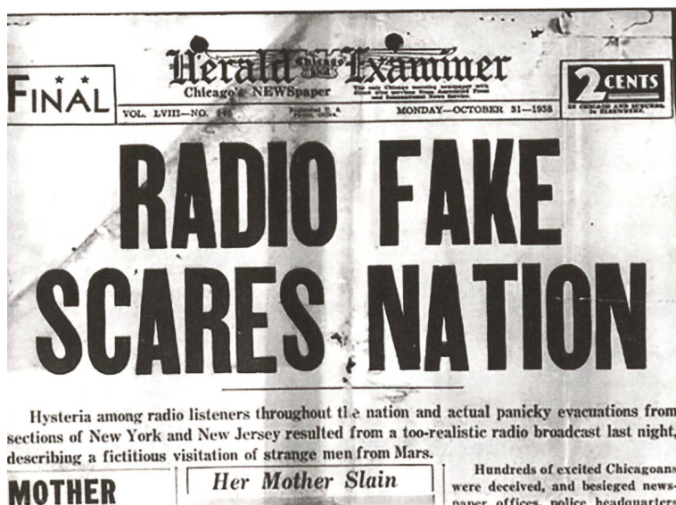
Die Titelseite des «Chicago Herald and Examiner» über den falschen Radiobroadcast 1938.