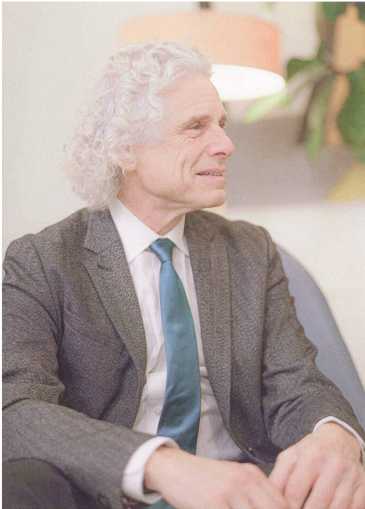
Steven Pinker, fotografiert von Selina Seiler.

«Die natürliche Reaktion ist, Menschen, die anderer Meinung sind, als gefährlich und dumm zu betrachten und zu glauben, dass sie zum Wohle der Allgemeinheit unterdrückt werden sollten.»