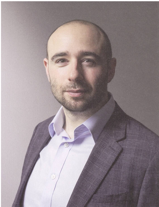
Yascha Mounk

britische Labour-Abgeordnete Nadia Whittome kürzlich: «Wir dürfen die Debatte nicht zum Fetisch machen, als wäre die Debatte selbst ein harmloser, neutraler Akt. Schon die bloße Debatte ist in diesen Fällen ein effektiver Angriff auf die Gleichheit und ein Fuss in der Tür für Zweifel und Hass.» Sogar noch offensichtlicher ist der Einfluss von Marcuse in der Arbeit des antirassistischen Bestsellerautors Ibram X. Kendi, etwa wenn dieser behauptet: «Rassistische Ideen sind sowohl falsch als auch gefährlich. Ich betrachte rassistische Ideen nicht als eine Form freier Rede. Ich betrachte sie als eine Form unfreier Rede.» Damit will Kendi sagen, dass er Rassisten das Wort verbieten möchte.