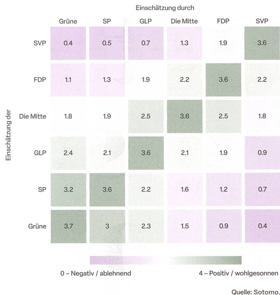
Repräsentative Sotomo-Befragung für die SRG. 31 850 Teilnehmende. Anfang Oktober 2023.