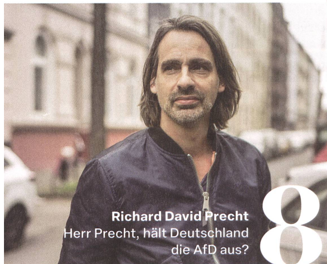
Richard David Precht Herr Precht, hält Deutschland die AfD aus?