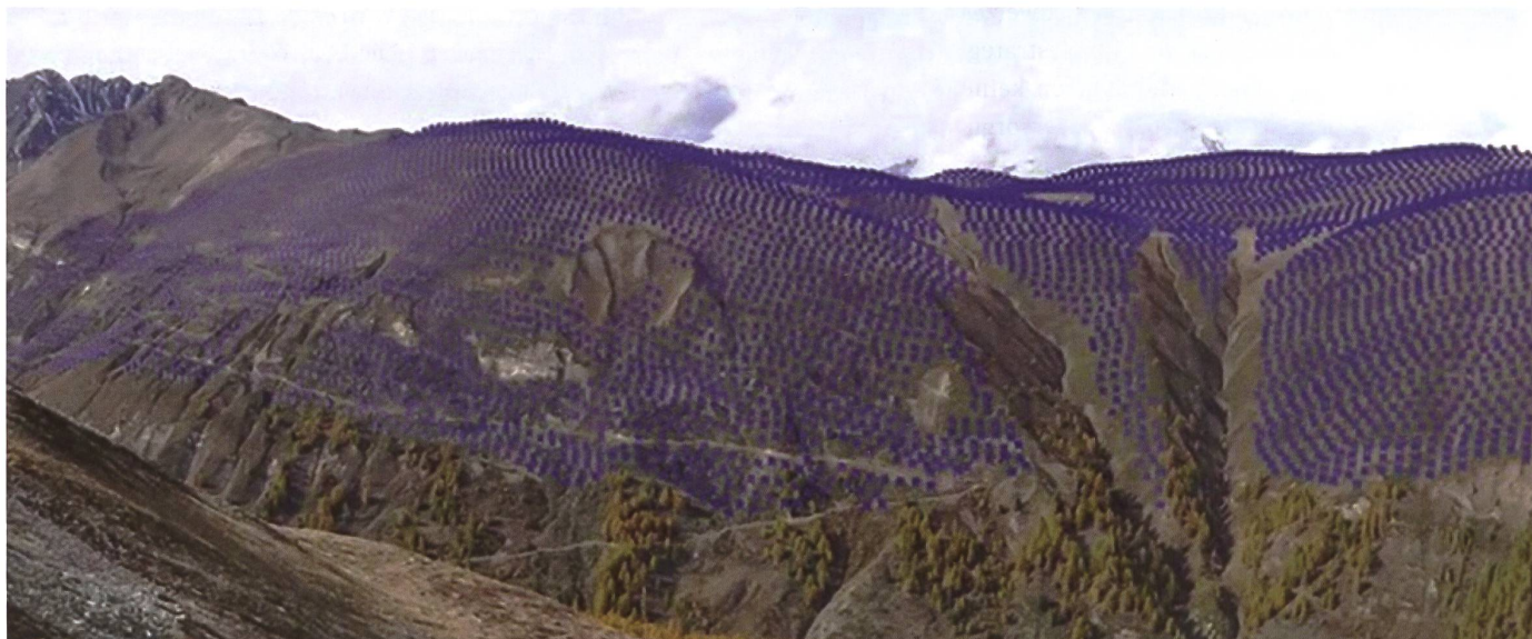
Modellbild der geplanten PV-Anlage Saflichtal-Grengiols mit 1500 MWp Leistung auf rund 2400 Metern über Meer.