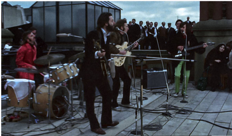
Die Beatles bei ihrem berühmten Dachkonzert, dem letzten Liveauftritt, am 30. Januar 1969.