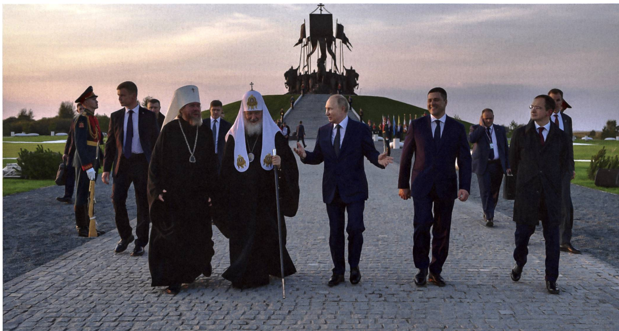
Die Klammer im russischen Reich war lange Zeit der orthodoxe Glauben: Wladimir Putin (Mitte) und Patriarch Kirill von Moskau (2. v.l.) im September 2021 an der Eröffnung der Gedenkstätte für Fürst Alexander Newski am Ufer des Peipussees, der zwischen Russland und Estland liegt.

zu tun, der sich vom römisch-katholischen Glauben unterscheidet: Für die Orthodoxie geht es bei Freiheit um die Opferbereitschaft als Weg der Reinigung. Deswegen ist Ostern, die Auferstehung, nicht Weihnachten das höchste Fest. Man müsse seine Individualität opfern, man müsse sich vom Stolz befreien, sich für die Gemeinschaft opfern, um Individualität zu gewinnen. Es gibt kein Privileg, das man für sich selbst im Verhältnis zu einem anderen akzeptieren kann. Dies ist die Grundlage der grössten Romane der russischen Kultur: Tolstois «Auferstehung», Pasternaks «Doktor Schiwago», Bulgakows «Der Meister und Margarita», Dostojewskis «Die Brüder Karamasow»: Überall müssen die Helden diesen Weg gehen.