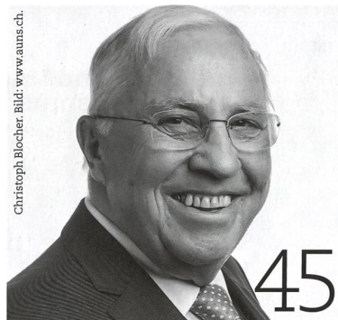
Christoph Blocher.