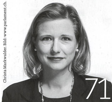
Christa Markwalder.