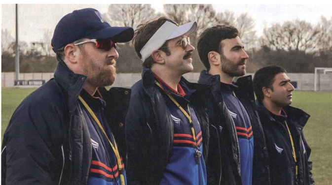
Der Trainerstab des AFC Richmond mit Ted Lasso (zweiter von links).

Die meisten Folgen bieten eine sehr unterhaltsame Mischung aus Charakterentwicklung, Humor, Wortspielen und Emotionen. Einige überdrehte Folgen – wie die Weihnachtsschmonzette in Episode 4 – tragen etwas gar dick auf. Und gegen Ende der zweiten Staffel wird ein Charakter überraschend als Bösewicht dargestellt, was der Serie eine neue Wendung gibt. Insgesamt aber bietet «Ted Lasso» weiterhin hochstehende und erfreuliche TV-Unterhaltung. (dj)