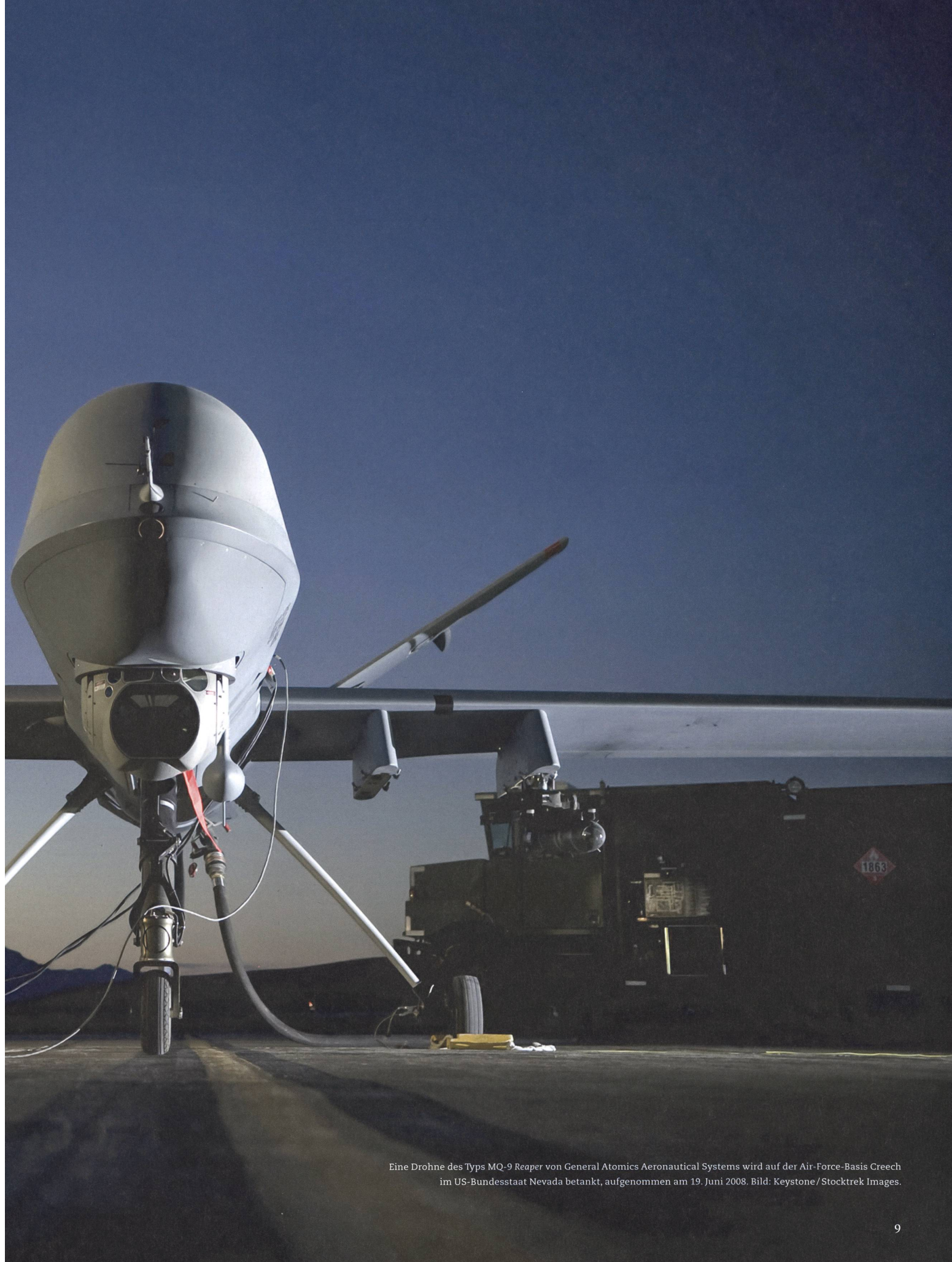
Eine Drohne des Typs MQ-9 Reaper von General Atomics Aeronautical Systems wird auf der Air-Force-Basis Creech im US-Bundesstaat Nevada betankt, aufgenommen am 19. Juni 2008.