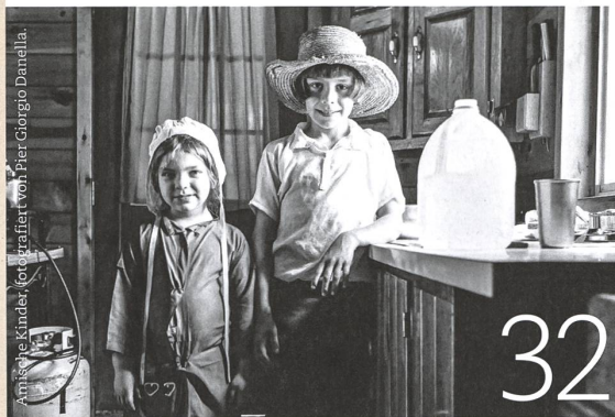
Amische Kinder, fotografiert von Pier Giorgio Danella.