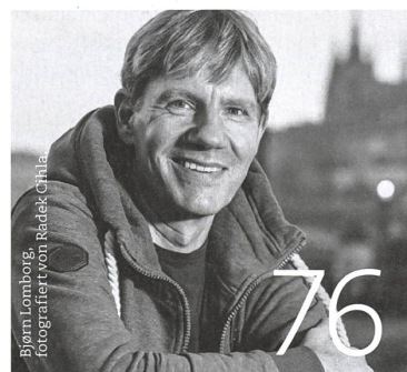
Bjørn Lomborg