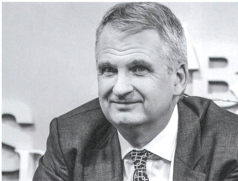
Timothy Snyder