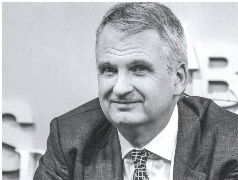
Timothy Snyder