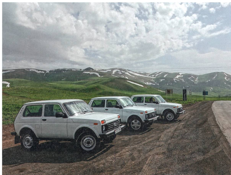
Mit drei Lada Nivas unterwegs in Arzach.