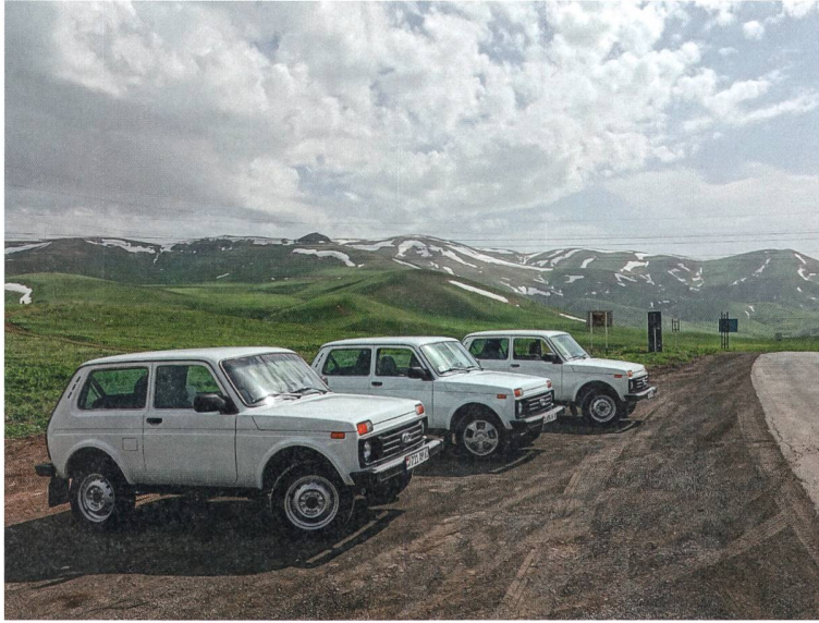
Mit drei Lada Nivas unterwegs in Arzach.