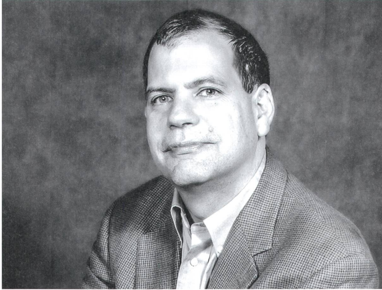
Tyler Cowen.