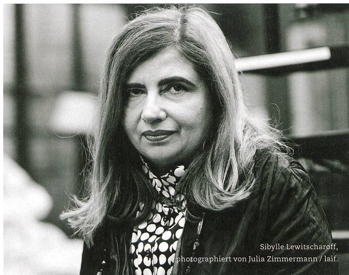
Sibylle Lewitscharoff