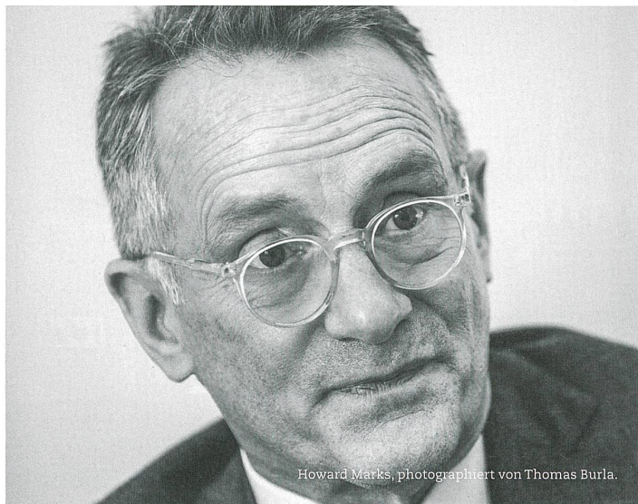
Howard Marks