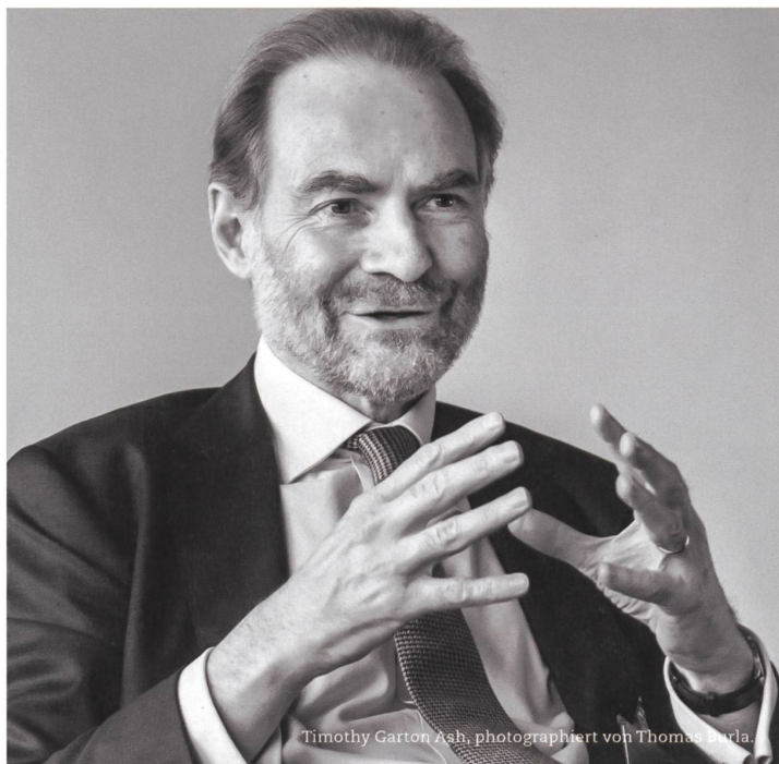
Timothy Garton Ash