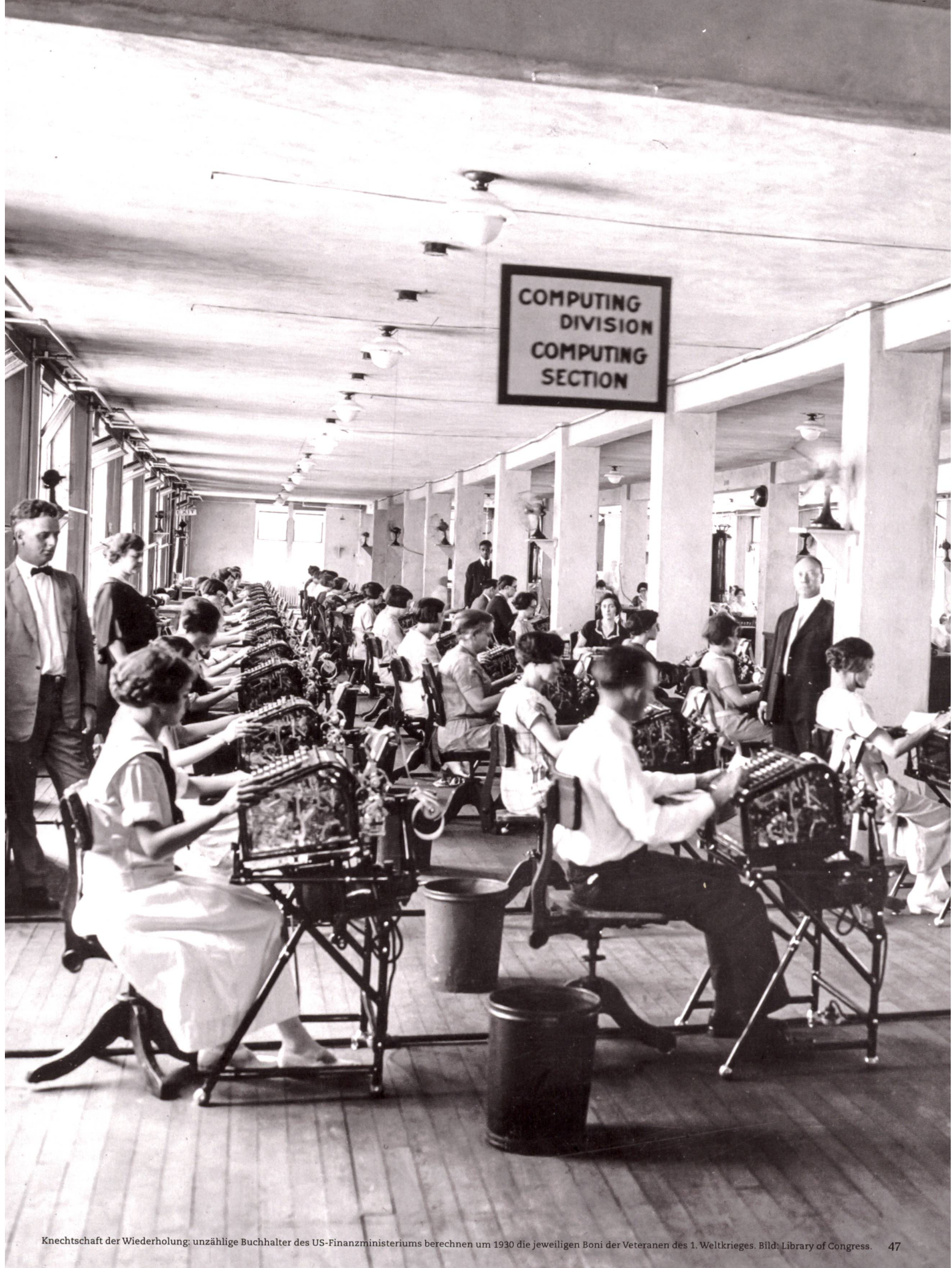
Knechtschaft der Wiederholung: unzählige Buchhalter des US-Finanzministeriums berechnen um 1930 die jeweiligen Boni der Veteranen des 1. Weltkrieges. 47