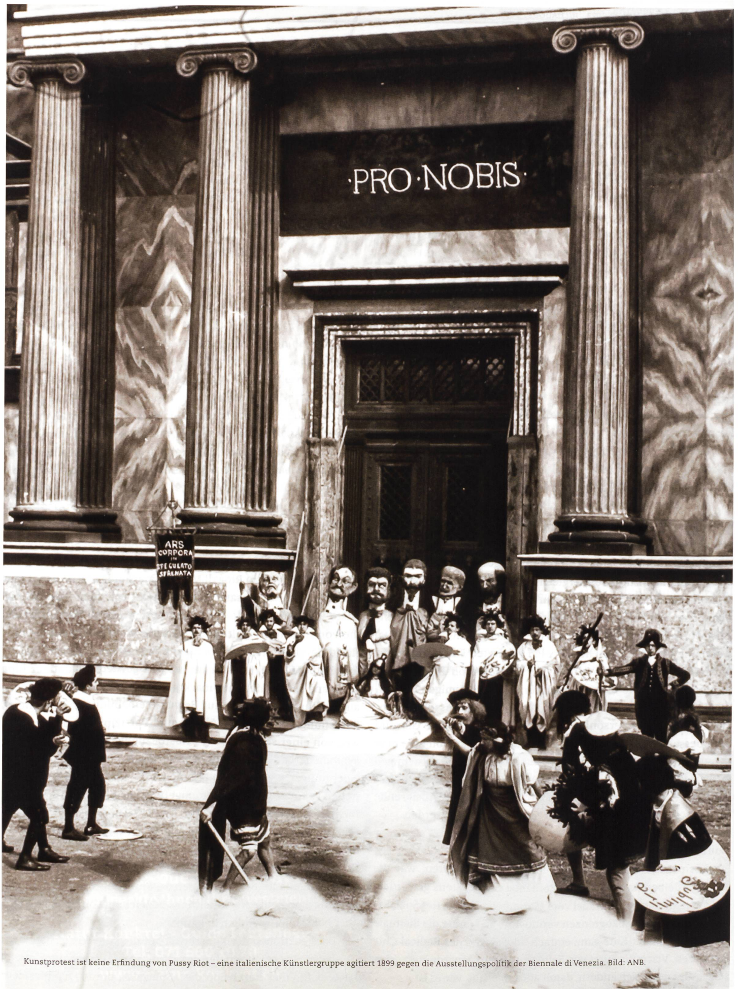
Kunstprotest ist keine Erfindung von Pussy Riot – eine italienische Künstlergruppe agitiert 1899 gegen die Ausstellungspolitik der Biennale di Venezia.