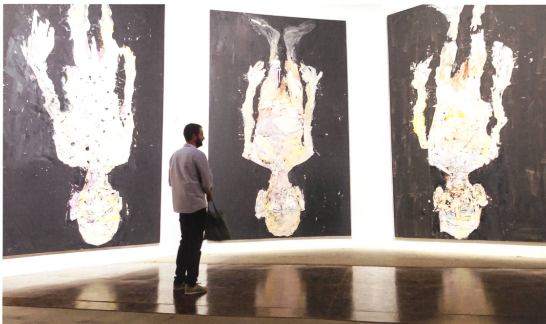
Altmeister Georg Baselitz steht immer noch kopf: Fällt von der Wand nicht (2014), acht rund 5 Meter hohe Selbstportraits.