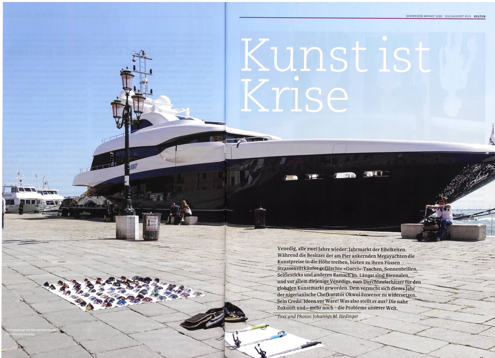
Warenauslage am Pier vor den Giardini der Biennale Venedig

Venedig, alle zwei Jahre wieder: Jahrmarkt der Eitelkeiten. Während die Besitzer der am Pier ankernden Megayachten die Kunstpreise in die Höhe treiben, bieten zu ihren Füßen Strassenverkäufer gefälschte «Gucci»-Taschen, Sonnenbrillen, Selfiesticks und anderen Ramsch an. Längst sind Biennalen, und vor allem diejenige Venedigs, zum Durchlauferhitze für den globalen Kunstmarkt geworden. Dem versucht sich dieses Jahr der nigerianische Chefkurator Okwui Enwezor zu widersetzen. Sein Credo: Ideen vor Ware! Was also stellt er aus? Die nahe Zukunft und – mehr noch – die Probleme unserer Welt.