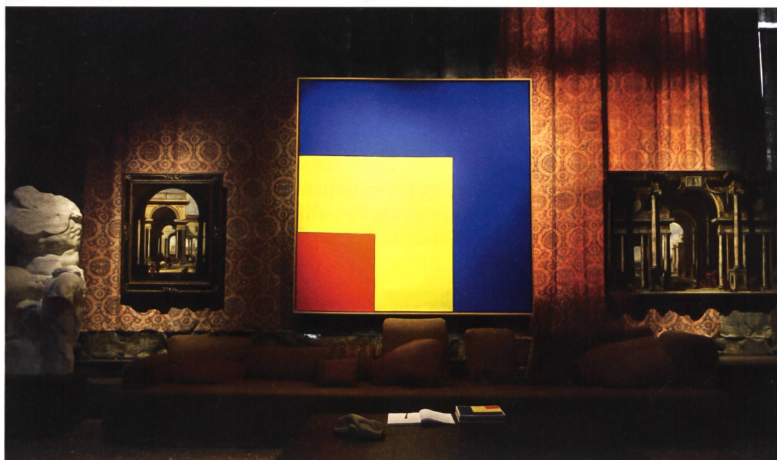
Niccolo Codazzi, Ellsworth Kelly, Viviano Codazzi. Palazzo Fortuny: Proportio (2015)