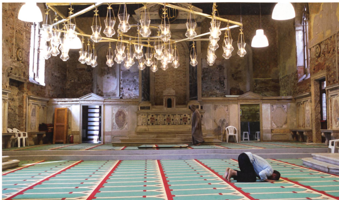
Christoph Büchel: The Mosque (2015)