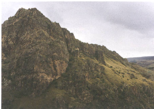
Rechts: die Höhlenstadt Vardzia; links: ihre Umgebung.