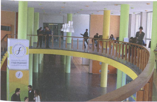
Rechts: Innenhof unserer Bleibe; links: die Free University und Nodar vor dem Newsroom Caffé.