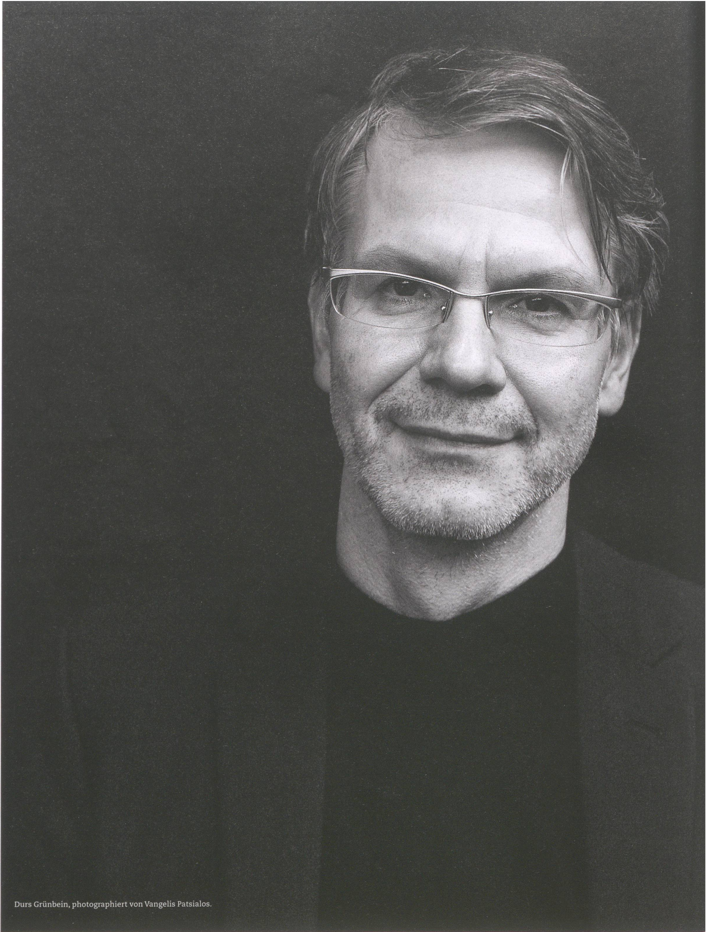
Durs Grünbein